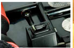
Transmission par cardans