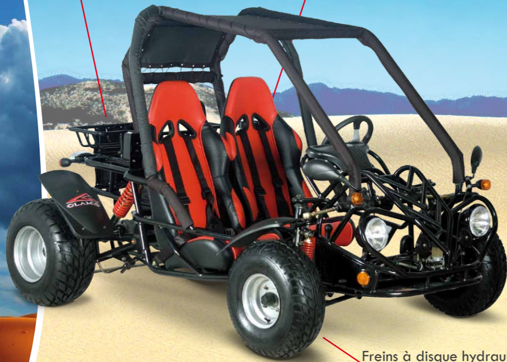
Freins à disque hydraulique